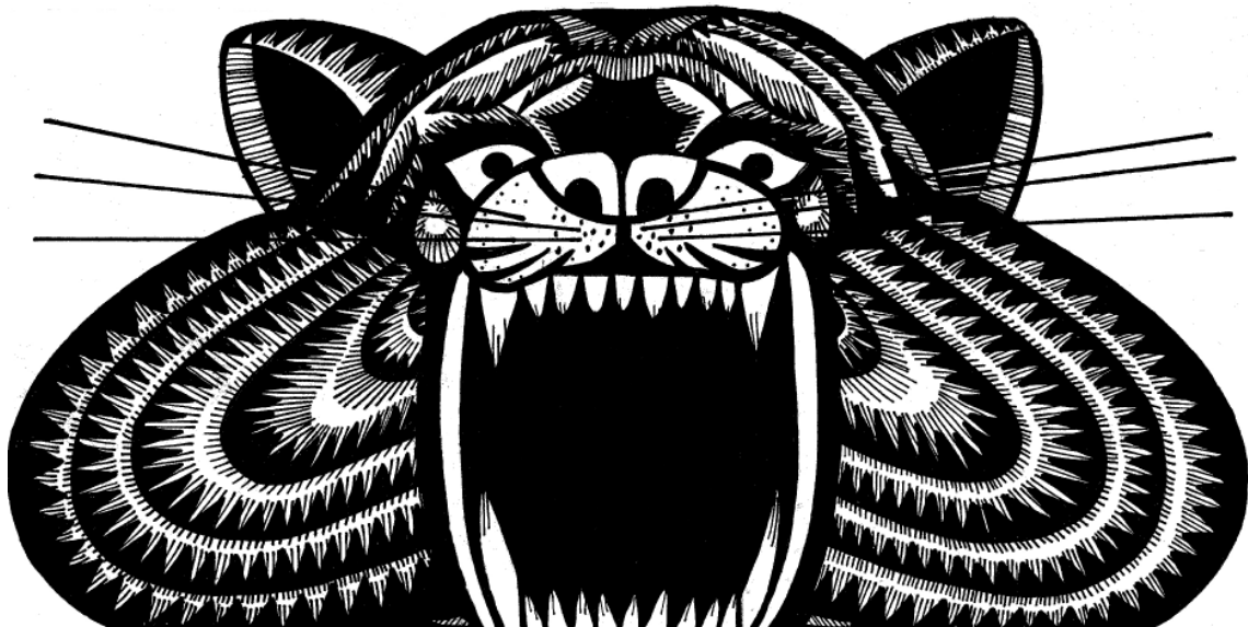
Abigail Lazkoz, Fiera negra , 2007 (detalle dibujo instalación)