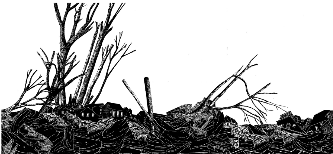
Abigail Lazkoz, Antihumanismo, 2007